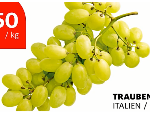
TRAUBEN WEISS ITALIEN / kg